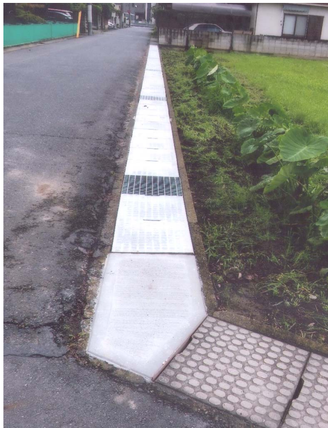
蓋が整備された「天川公園」南側道路の側溝

・埼玉県や秋田県では、すでに「AI」導入による「出会いの場」を提供して実効をあげている自治体もあることから、本市としても「AI」や相手を紹介するシステムを導入するなど、新たな事業展開を模索し、人口減少に歯止めをかける仕掛けも必要であると考えますが、見解を伺います。